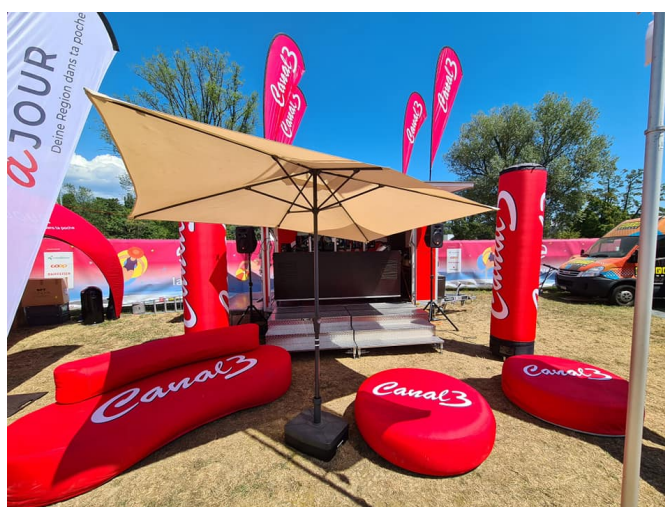
Live-Sendung Lakelive Festival 2022, August 2022