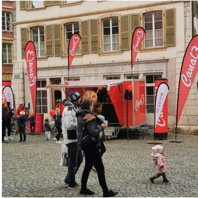
Live-Sendung First Friday, Mai 2022