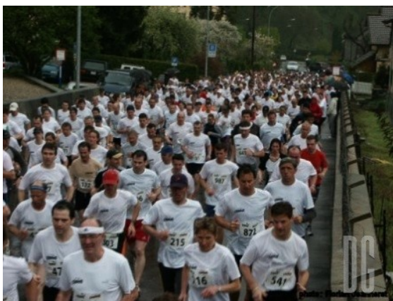
Étapes du Tour du Chablais

En six étapes, le mercredi soir, un peloton fort de 700-800 coureurs sillonne les routes et les chemins du Chablais où des parcours accessibles à tous sont préparés. Ce peloton est essentiellement composé de « populaires ». Lorsque les écoliers courent, ils sont plus de 1000, âgés de 15 à 75 ans, à participer à cette fête.