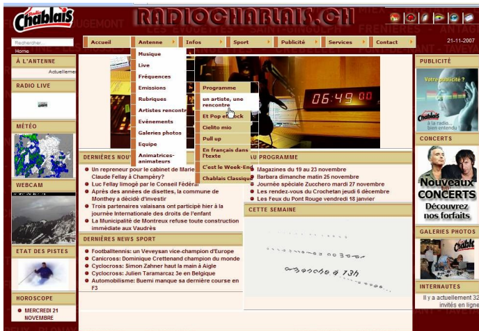
Site Internet Radio Chablais (2008), avec podcast

Avec des techniques telles que le podcast, elle peut aussi pallier le problème que pose l'instantanéité de la radio en permettant la réécoute, ou l'écoute, de certains éléments du programme. Cela concerne en priorité les informations.