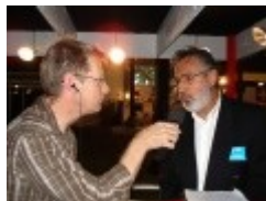
Radio Chablais au Comptoir de la Riviera 2007, à Montreux