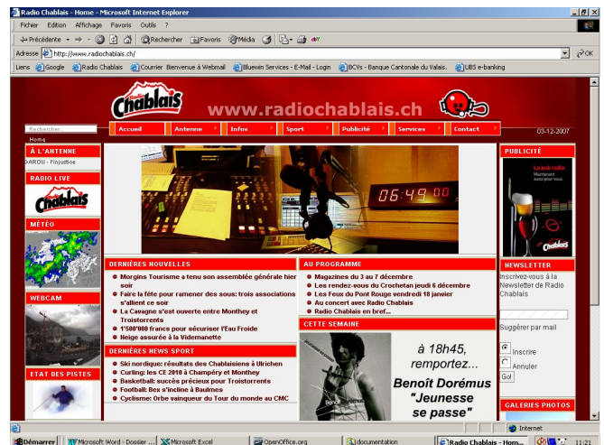
Site Internet Radio Chablais (2007)