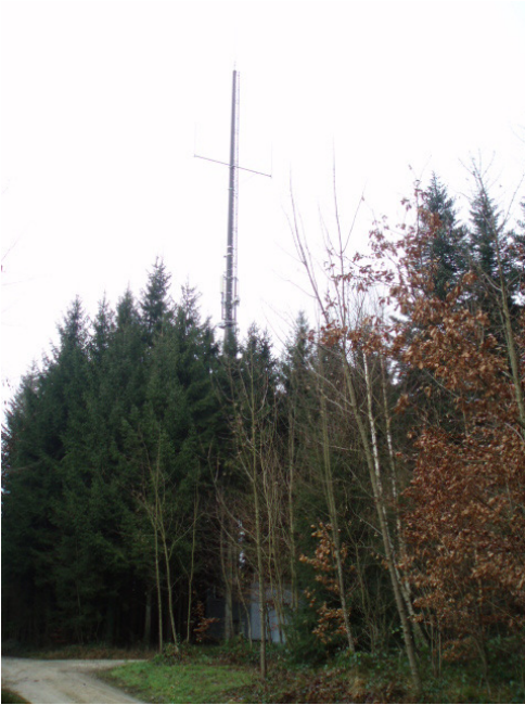
Beilage 6 d.b: Senderstandort Aarau gross, Senderstandort Aarau klein