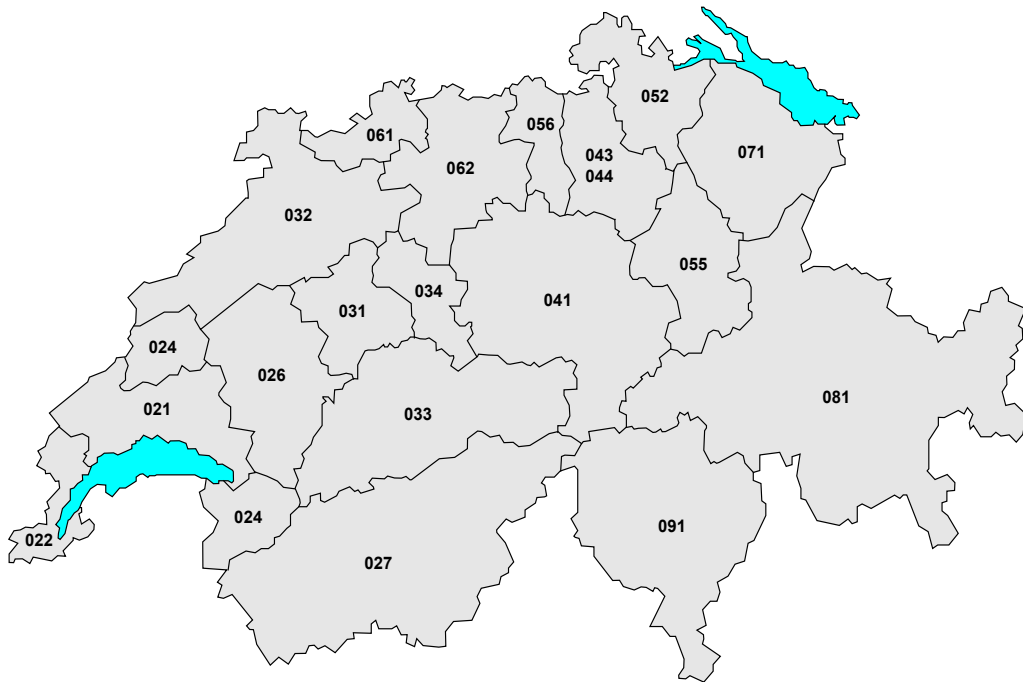
Figura 1: Indicativi per i servizi di rete fissa del piano di numerazione E.164